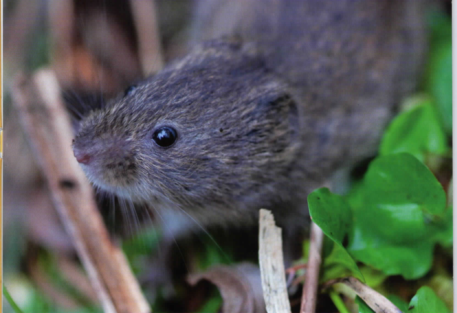
Noordse woelmuis.

Geschiedenis en toekomst van de noordse woelmuis