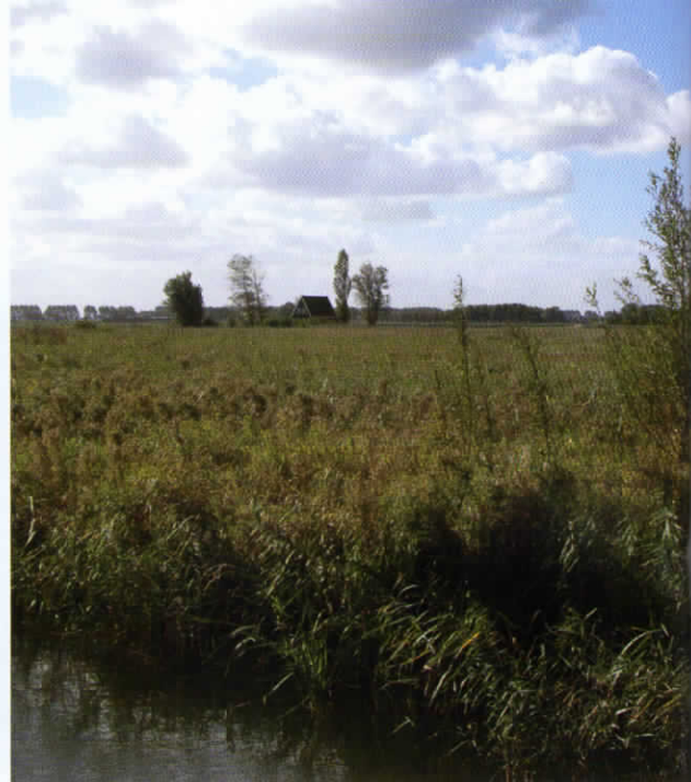
Huidig noordse woelmuis habitat in Nederland.

waaronder de lemmingen, trokken met de natte toendra mee naar het noorden. Tegenwoordig komt de halsbandlemming binnen Europa alleen nog maar voor op de natte toendra's in Siberië ten oosten van het Kola-schiereiland (Moermansk). De soort leeft daar samen met een verwant die we wel nog steeds in ons land aantreffen: de noordse woelmuis ( Microtus oeconomus ).