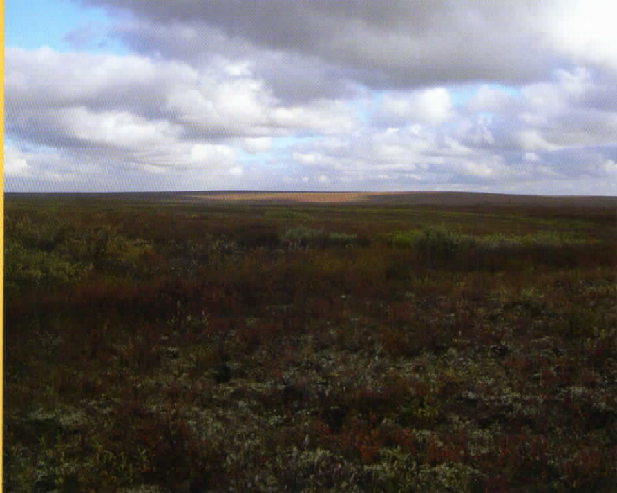
Beeld van noordse woelmuis habitat toen Nederland nog een toendra landschap was.